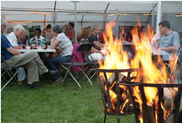
Een van de gezellige barbecues.

Het bestuur heeft hard gewerkt aan een mooi programma voor het komende jaar en heeft de definitieve activiteitenkalender klaar! Een eerste prachtige activiteit kent u al: het uitstapje naar Duitsland. Verder volgen nog de gezellige barbecue, buitenspeeldagen, disco et cetera.