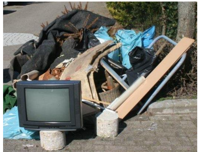
De score van de afgelopen jar(en)

Zoals u ziet zijn de tijden en ook de dag anders dan eerder aangeven. De reden hiervan is dat de gemeente Zwolle de opschoondag op 17 maart organiseert (ipv 10 maart). Ook beginnen we dit jaar eerder om zo in lijn te lopen met de rest van Zwolle – zuid.