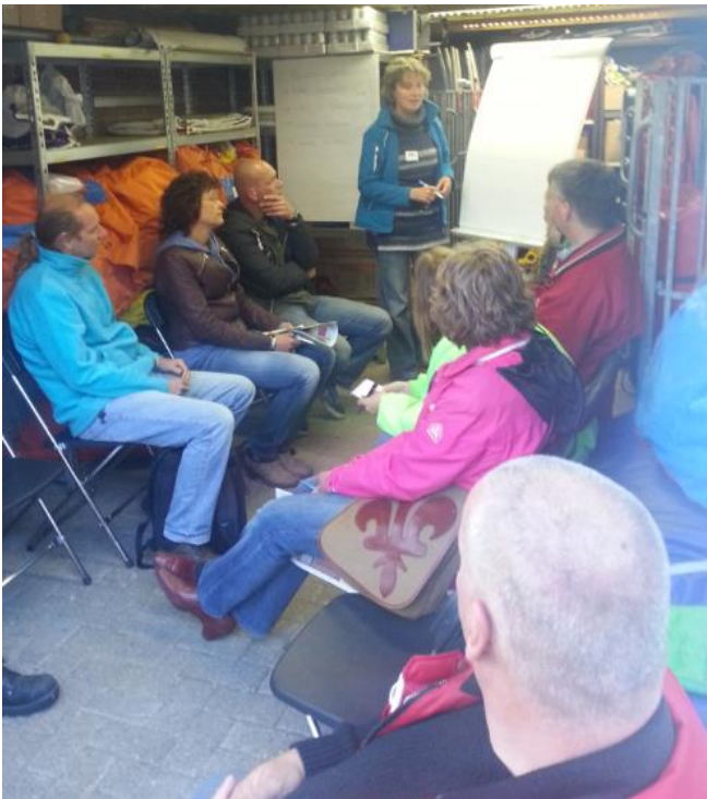
In de opslagschuur van BaBuTi.