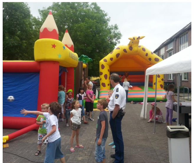
Een impressie van de buitenspeeldag

De aanwezigen troffen het met het mooie weer. Ook de politie, de Gemeente en Travers gaven blijk van hun belangstelling.