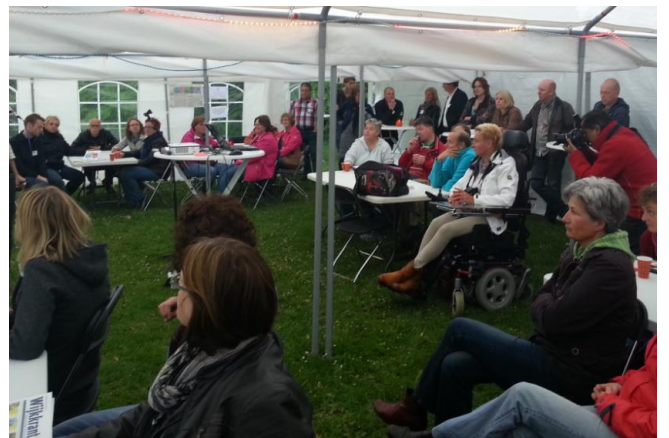
In de grote tent.