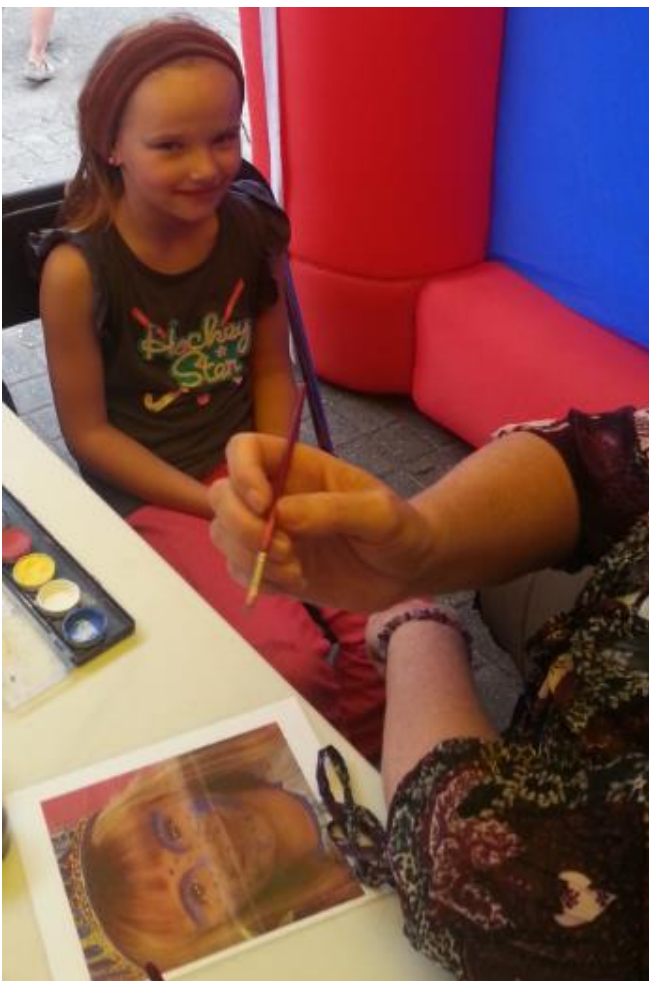
Spannend, hoe zal ik er straks uitzien?