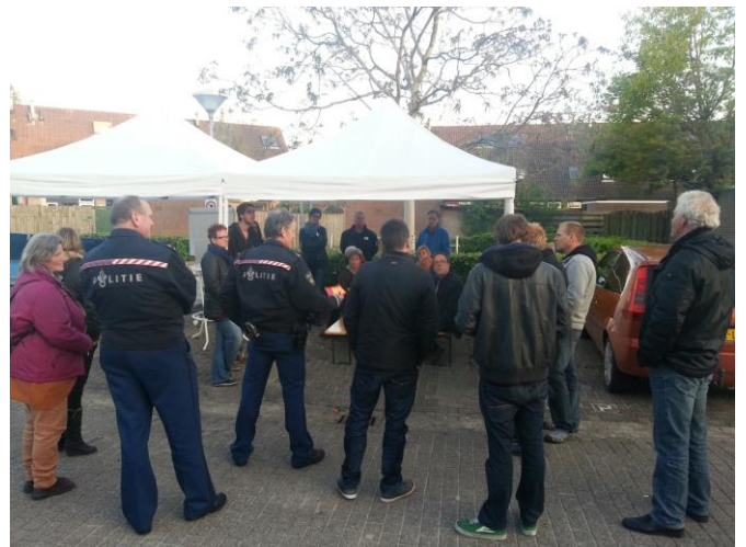
Een van de vijf locaties waar een voor de buurt/wijk belangrijk onderwerp werd besproken.