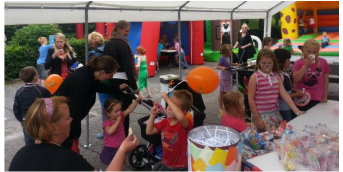
Ballonnen, schmink, limonade en snoep!

Uit al deze foto's blijkt de enorm grote opkomst. Zelfs kinderen van de verschillende Buitenschoolse Opvangadressen in de wijk kwamen op bezoek!