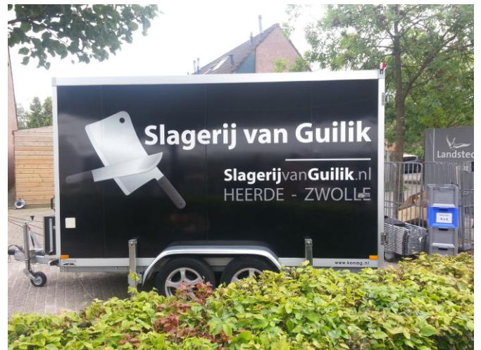
De wagen met alle lekkernijen voor de BBQ.

Onze samenwerking met Slagerij Van Guilik ( www.slagerijvanguilik.nl ) wordt ieder jaar beter. Dit jaar konden we zowel de barbecues, het vlees, het ijs en ook vrijwel alle overige boodschappen bij hen bestellen. Erg praktisch dat dit kan en de kwaliteit is goed.