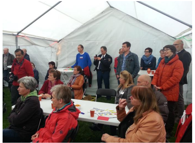
Geconcentreerd luisterend naar de spreker.

Omdat deze wijkavond voor de eerste keer door BaBuTi werd gefaciliteerd, was het voor haar spannend hoeveel mensen er zouden komen. Dat blijken zo'n 120 mensen te zijn geweest! De betrokkenheid bij onze buurt (en de rest van de wijk) is dus groot! Compliment aan alle deelnemers voor hun bijdrage!