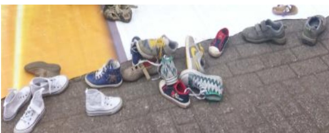
Schoenen uit als je de springkussens in wilt.