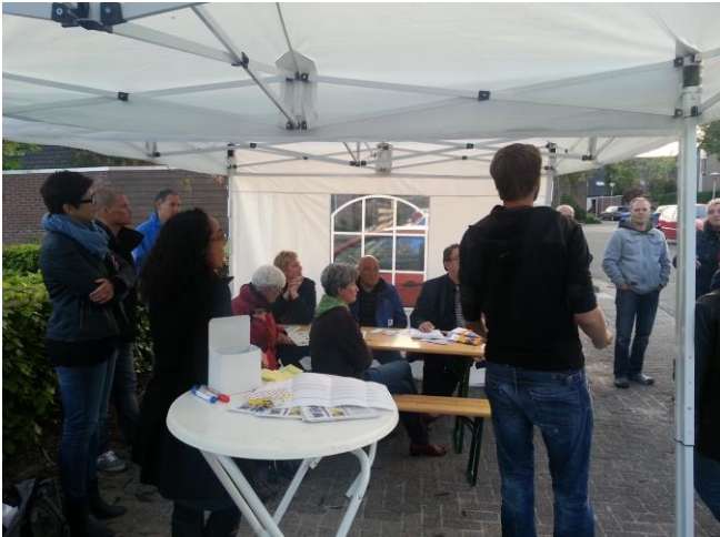
Weer een andere gespreksgroep met een ander onderwerp.