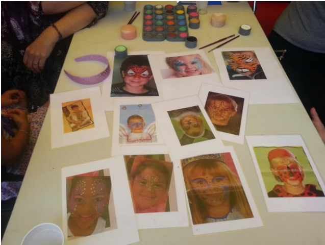
Foto's van de gegrimmeerde kindergezichtjes.