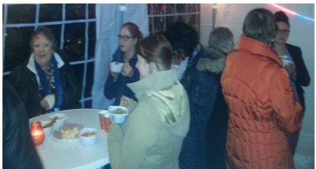
Hierboven enkele foto's van de bijeenkomst.